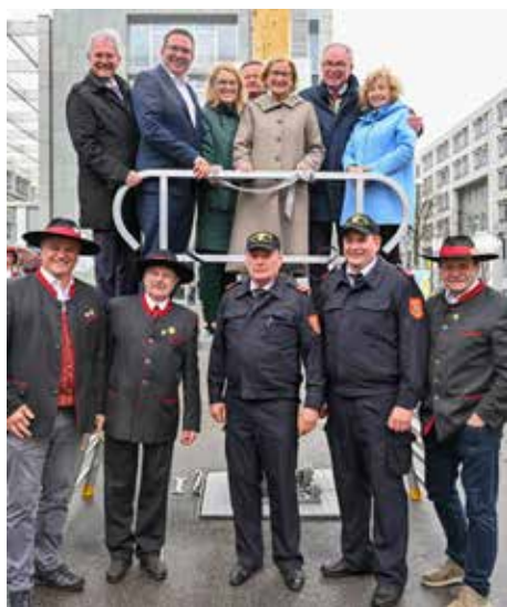
Das traditionelle Maibaum-Aufstellen im Regierungsviertel St. Pölten.

Der Maibaum stehe aber auch für Traditionsbewusstsein und das Verbindende in Niederösterreich, „in einer herausfordernden und schnellebigen Zeit, in der das aufeinander zugehen und gemeinsam nach vorne blicken ein Zeichen gegen den wachsenden Trend der Oberflächlichkeit ist“, sagte die Landeshauptfrau. Zum Dritten sei der Maibaum „sichtbares Symbol für den Weg in die Zukunft“, wo es vor allem wichtig sei, Partnerschaften zwischen Land, Gemeinden und Städten weiter zu leben und „weiter zusammenzustehen, zusammenzuhalten und alles zu tun“, führte Mikl-Leitner aus, „um die Menschen in Niederösterreich gut durch die Krise zu begleiten und damit gut in die Zukunft zu führen.“