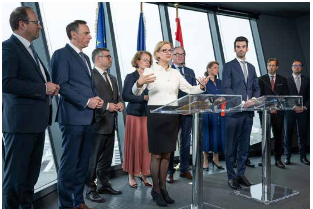
Landeshauptfrau Johanna Mikl-Leitner und LH-Stellvertreter Udo Landbauer informieren über die Ergebnisse der ersten Regierungsklausur.

Die neue Landesregierung sei knapp ein Monat im Amt und habe in den ersten Wochen bereits konkrete Maßnahmen auf den Weg gebracht, verwies die Landeshauptfrau eingangs auf den neuen Pflegescheck, die Abschaffung der ORF-Landesabgabe oder die Einführung des Wohn- und Heizkostenzuschusses. In der ersten gemeinsamen Regierungsklausur gehe es um „die nächsten Meilensteine“, so Mikl-Leitner. Eine wichtige Voraussetzung dafür seien „stabile Finanzen“, und daher habe man heute auch den Startschuss für die Erstellung des Budgets