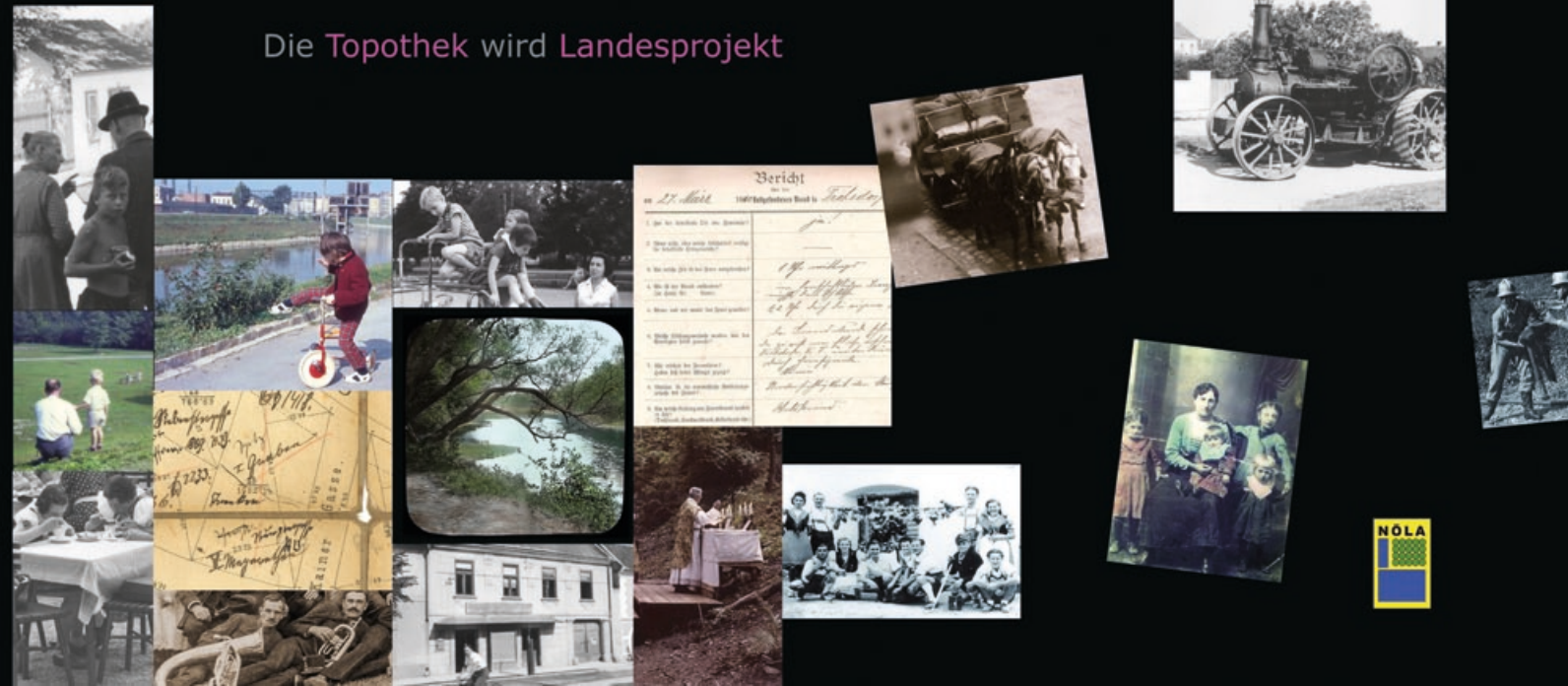
Die Topothek wird Landesprojekt

INTERNATIONAL CENTRE FOR ARCHIVAL RESEARCH