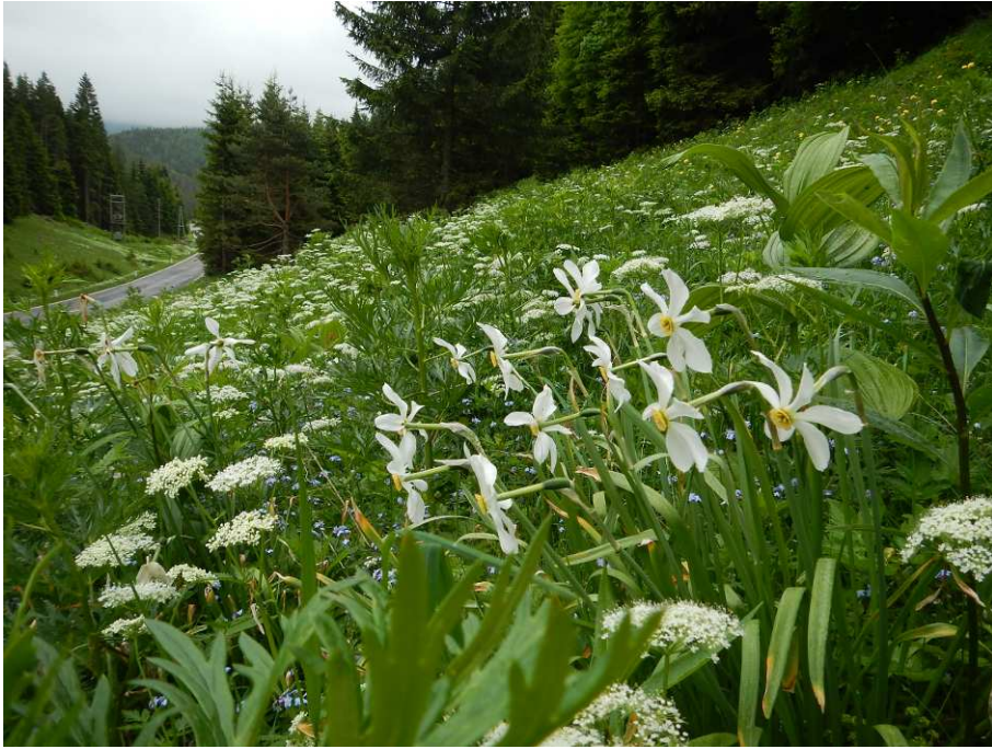
Abb. 1: Artenreiche Wiesenbrache im Karnerbachtal nordöstlich von Ulreichsberg im Übergang zwischen Goldhaferwiese und Hochstaudenflur