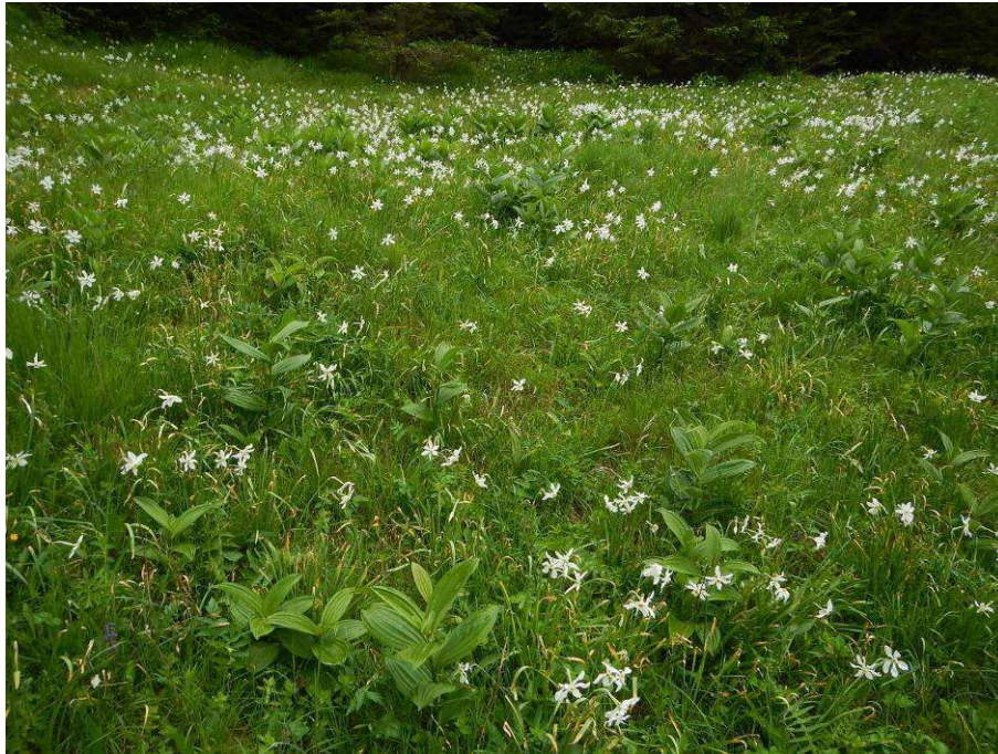
Abb. 2: Hochstaudenreiche Goldhaferwiese am Kernhofer Gscheid

Eine weitere Erschwernis besteht darin, daß einige der in MUCINA et al. (1993) und ELLMAUER (2004) als relevant für den Wiesentyp erachtete Arten in den Kartierungsgebieten auch als Brachezeiger in mehr oder weniger hochstaudenreichen Wiesen und Weiden in Erscheinung treten. Dies trifft für das Waldviertel vor allem für Hypericum maculatum und Persicaria bistorta zu, für die Voralpen zusätzlich für Astrantia major , Chaerophyllum aureum und Trollius europaeus zu. Im Grunde genommen sind diese Arten lediglich als Höhenzeiger einzustufen. Die als diagnostisch wichtig erachtete Narzisse ( Narcissus radiiflorus ) besitzt einen zweiten Schwerpunkt ihres Vorkommens in Feuchtwiesen des Calthion .