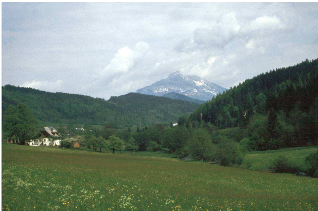
Abb. 3: Wiesen in walddominierter Landschaft in Lassingrotte am Fuß des Ötschers

Einzelne Außenposten des Lebensraumtyps 6520 wurden schließlich auch noch im Bereich der vereinzelt Waldwiesen im Bergland bei Kernhof gefunden.