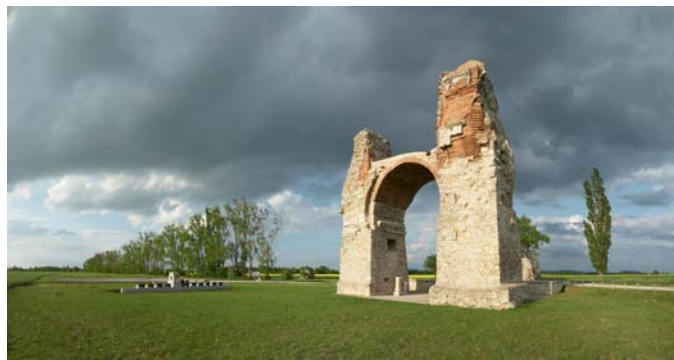
Archäologischer Park Carnuntum, Heidentor