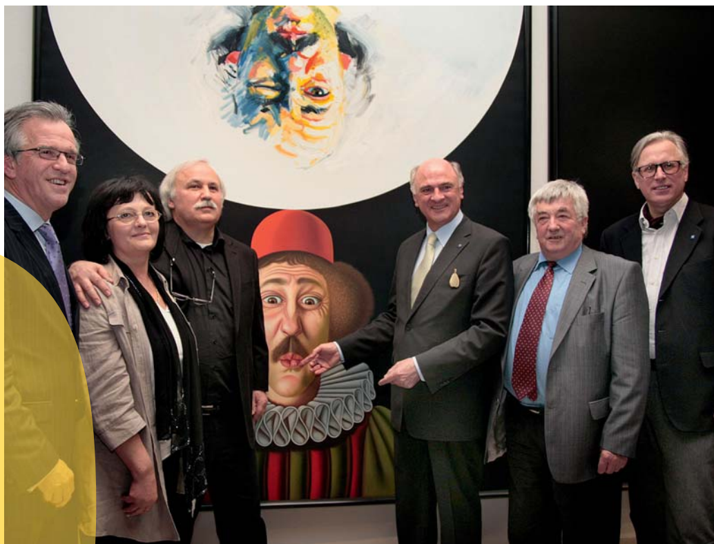
Landesmuseum, Eröffnung der Ausstellung «Kaspar und andere Kinder» von Josef Bramer am 26. April 2008