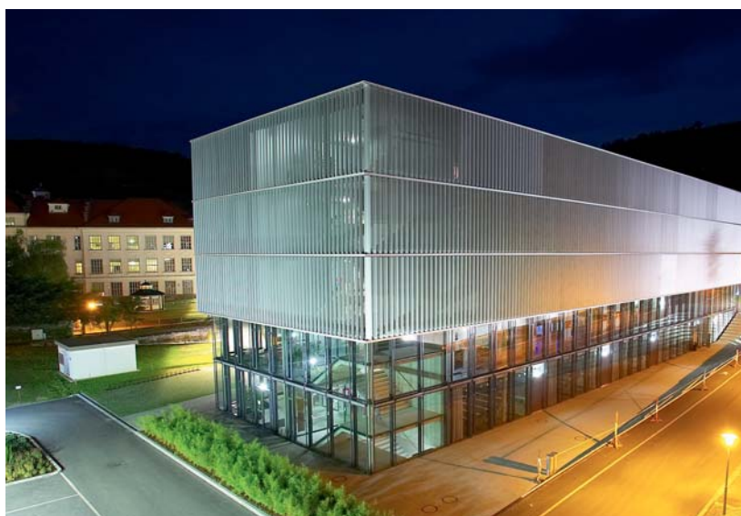
IMC Fachhochschule Krems