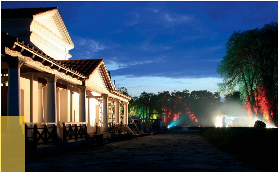
Freilichtmuseum Petronell, Villa Urbana – römisches Stadtpalais