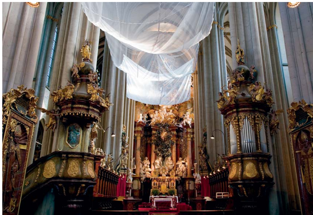
Egedacherorgan im Zwettl, Stiftskirche