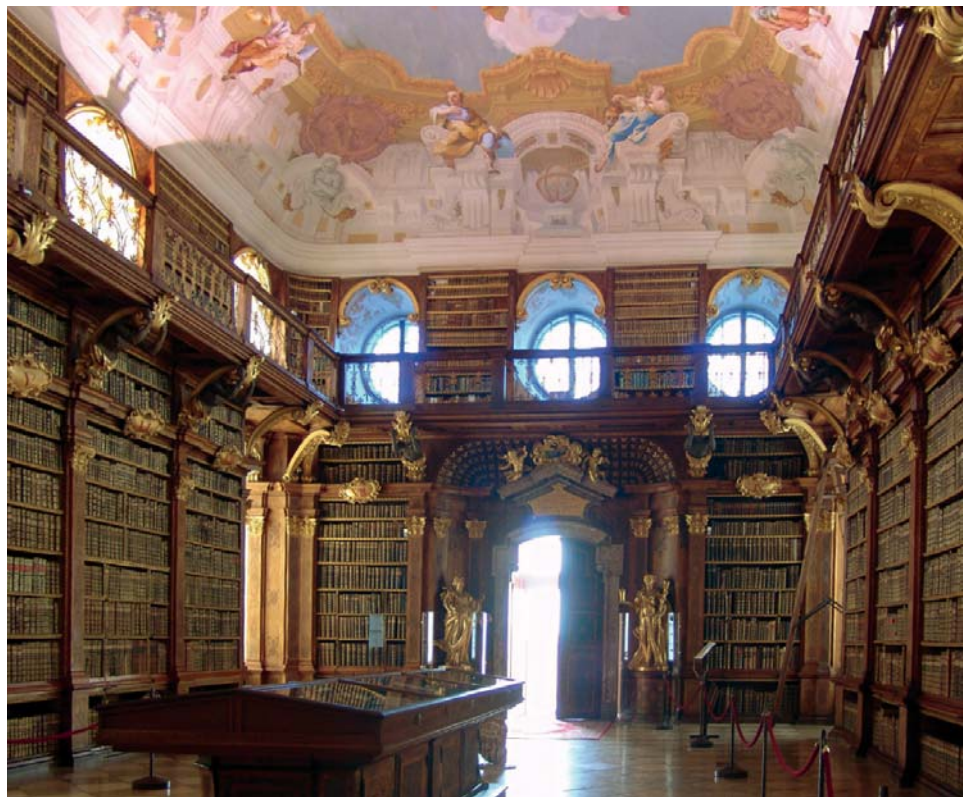
Stift Melk, Bibliothek, © Foto: Walter Hochauer