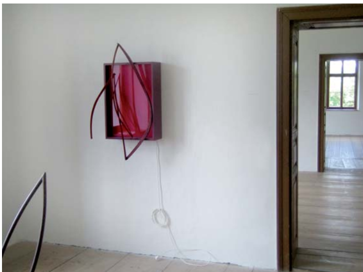
Blau-Gelben Viertelsgalerie, Weistrach, © Foto: Leopold Kogler

Auch in der Sparte bildende Kunst werden Preise des Landes Niederösterreich jährlich vergeben. Der Würdigungspreis dient der Ehrung eines Gesamtwerkes, das überregionale Bedeutung hat. Die Anerkennungspreise dienen der Förderung jener Künstlerinnen und Künstler, deren Arbeitsbereiche fachliche Anerkennung gefunden haben, ohne dass ein Gesamtwerk bereits vorliegt. Das Niederösterreichische Landesmuseum erhielt im Jahr 2007 seitens des Bundesministeriums für Unterricht, Kunst und Kultur Förderungsmittel in der Höhe von 36.500,- Euro die für Ankäufe zeitgenössischer Kunst aus österreichischen Galerien zweckgewidmet waren und aus Landesmitteln – gemäß Förderungsbedingungen – im Ausmaß von mindestens 50 Prozent erhöht wurden.