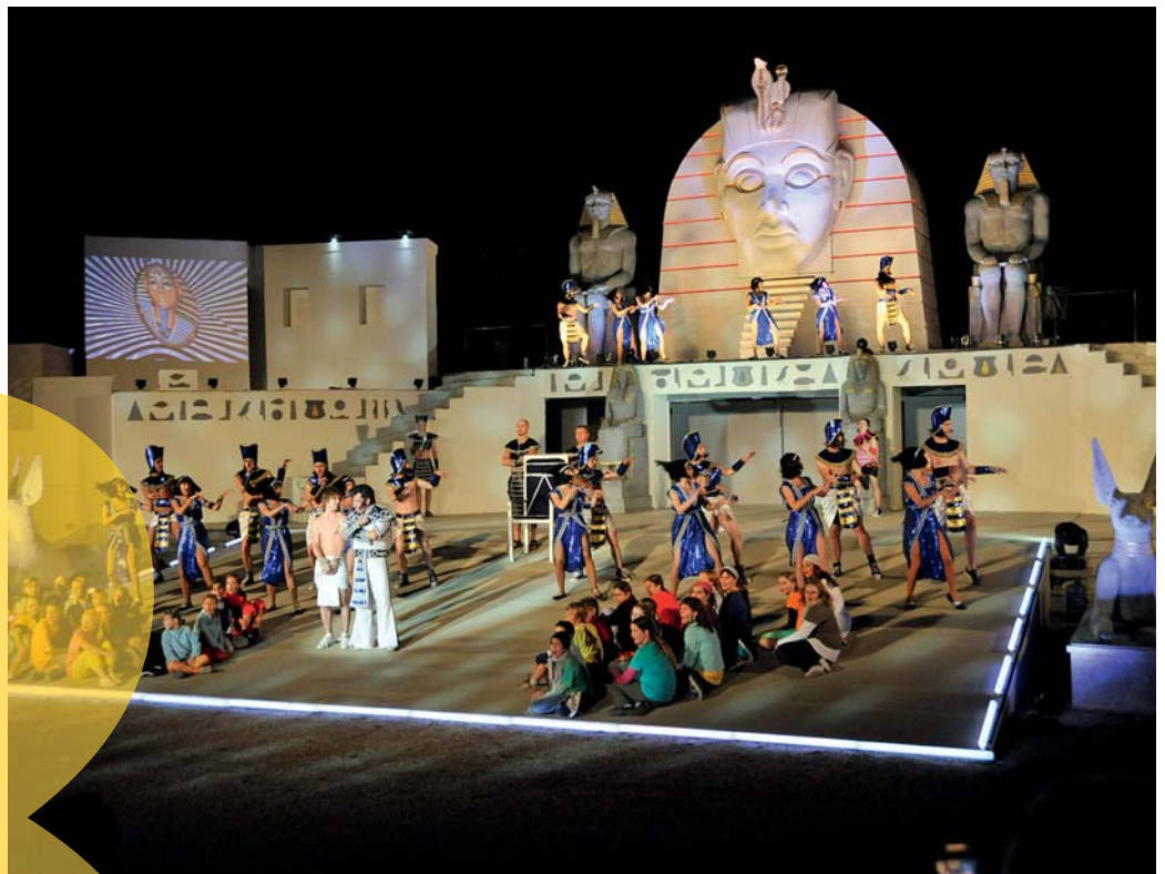
Staatz, Premiere «Joseph and the Amazing Technicolor Dreamcoat», am 18. Juli 2008