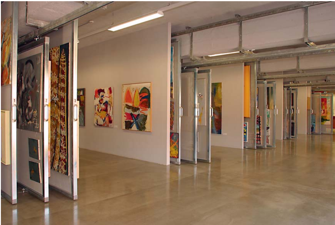
Arthothek, Krems Foto: Martin Vavra, © Arthothek Noe