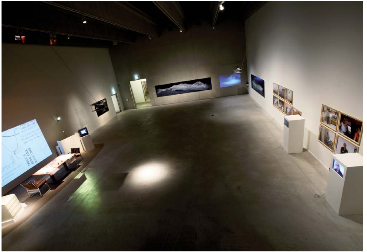
Kunsthalle Krems, Blick in den Ausstellungsraum