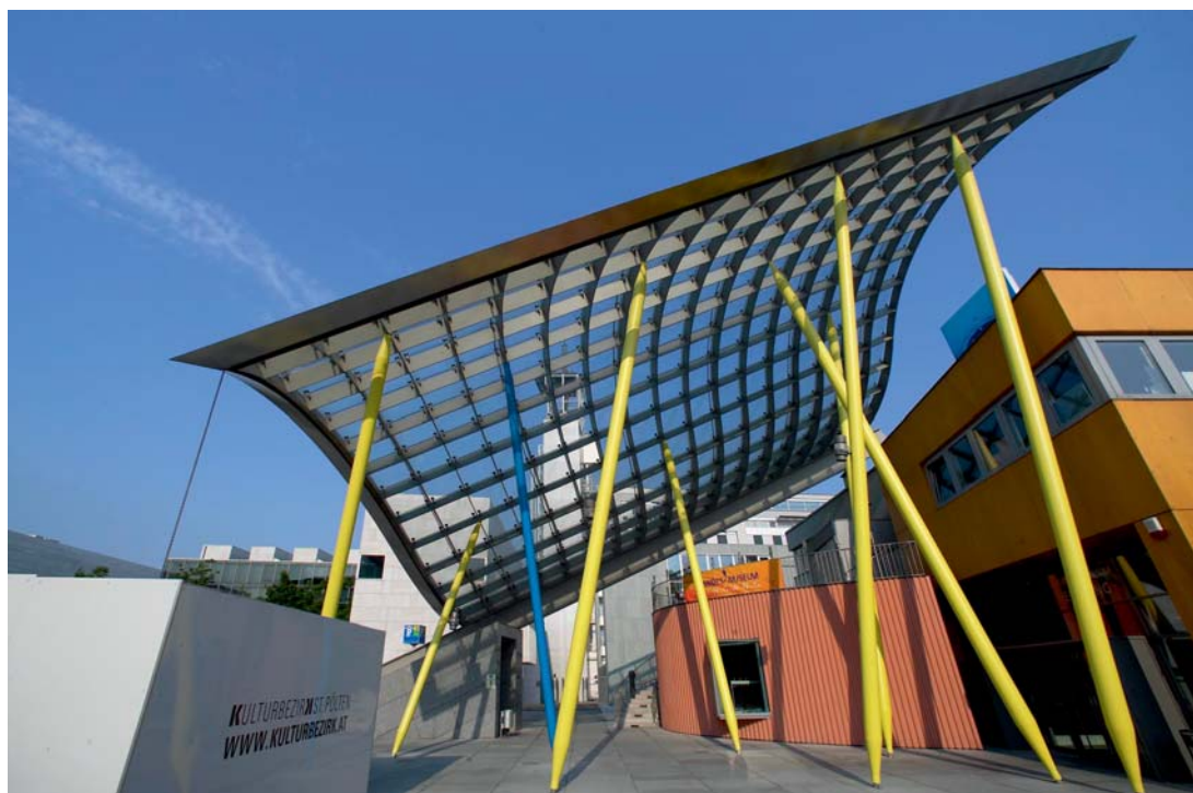
Niederösterreichisches Landesmuseum, Eingangsbereich vor dem geplanten Umbau, St. Pölten