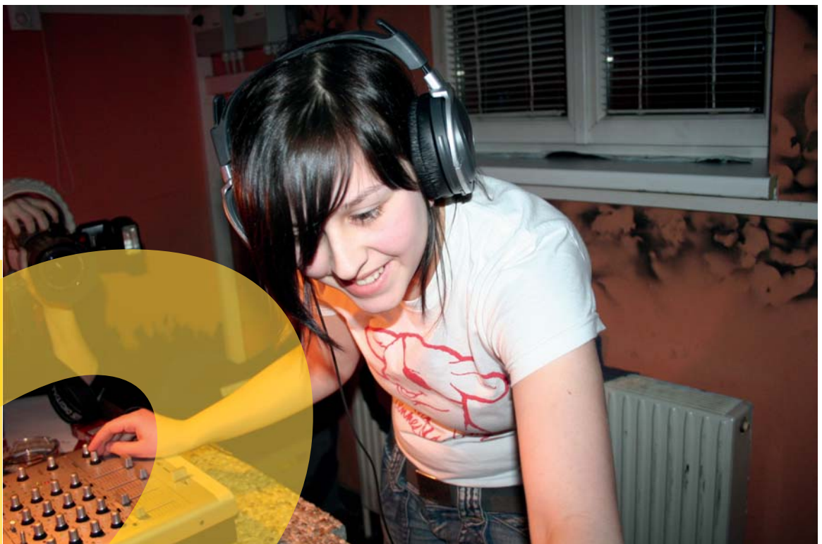
Jugend- und Kulturhaus «Triebwerk», DJane, Wiener Neustadt, © Triebwerk