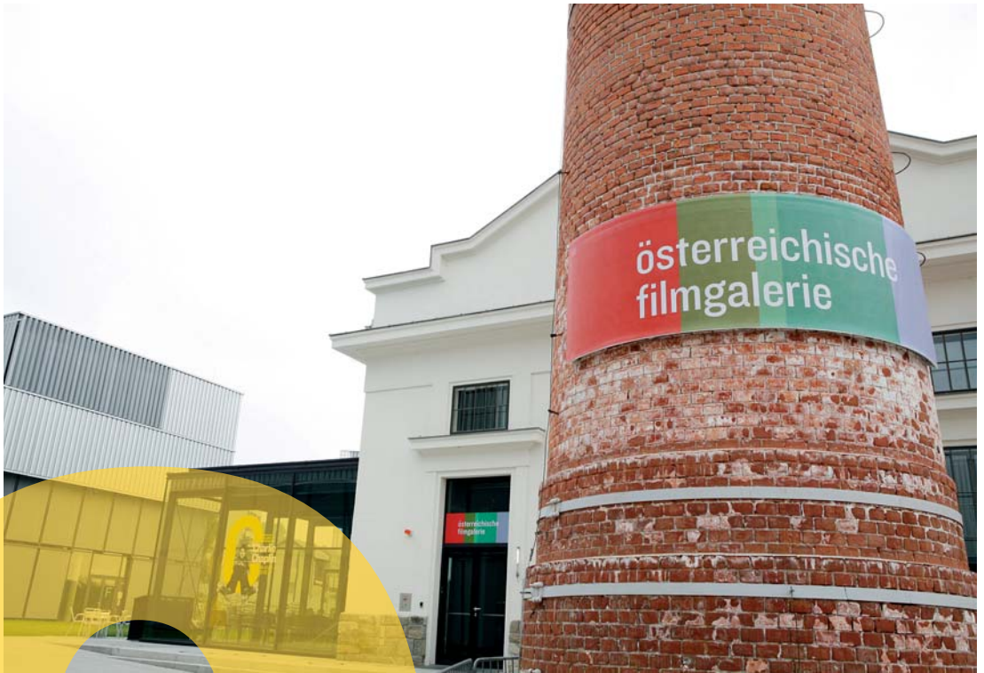
Filmgalerie, Kino im Kesselhaus