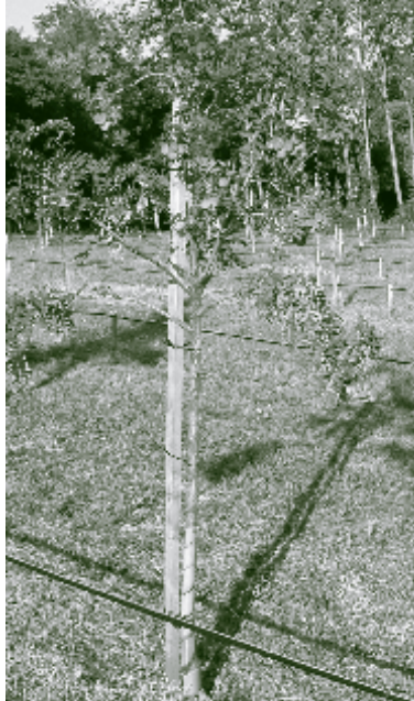
Speierling-Reisergarten in der HBLA Klosterneuburg.

in die Obstgärten geholt. Speierlingfrüchte ergeben nicht nur einen hervorragenden und hochpreisigen Schnaps, sie sind nach kurzer Lagerung durchaus angenehm herb im Geschmack und wurden dem Most als Klärungsmittel beigemischt. Das Holz ist ausgesprochen hart und eignet sich gut als Furnierholz oder zum Drechseln von stark beanspruchten Werkteilen wie z.B.: Spindeln von Weinpressen oder Radnarben.