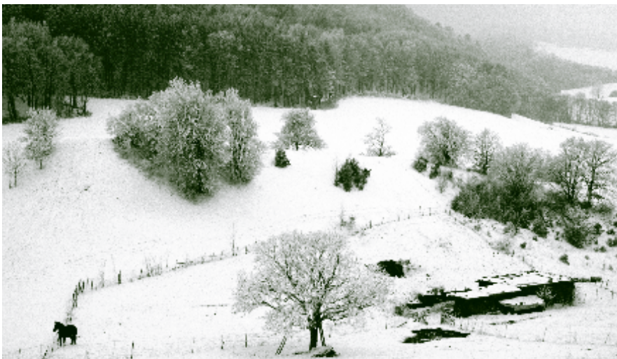
Immer mehr Pferde im Wienerwald brauchen Weiden als Auslauf und Heu als Futter (Dornbach, 2002).

Durch die vermehrte Pferdehaltung im Wienerwald in den letzten 20 Jahren steigt der Bedarf nach ballaststoffreichem Heu. Dadurch wird auch die Tradition des Heuhandels wieder neu belebt. Für die Erhaltung der Wienerwaldwiesen ist das eine sehr positive Entwicklung.