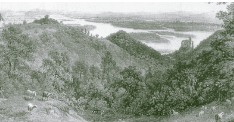
Waldweide in Greifenstein.

In den Schwarzföhrenwäldern des südlichen Wienerwaldes lag die Sache anders. Hier war die Waldweide nicht nur erlaubt sondern sogar erwünscht. Denn das Vieh fraß mit Vorliebe die jungen Triebe der Laubbäume und sorgte damit für den Fortbestand der reinen Föhrenwälder für die Pecherei. Bis in die 1950er Jahre gab es z.B. in Hernstein noch einen eigenen Halter, der die Kühe aus dem Dorf in den Wald trieb.