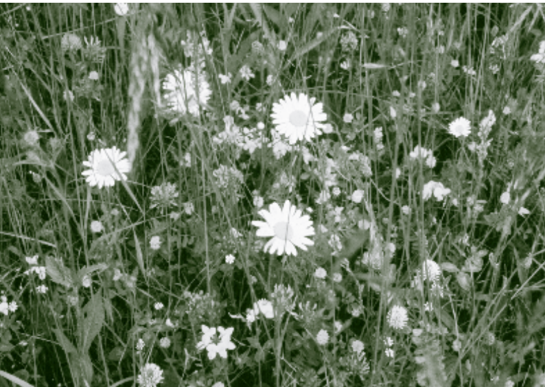
Margeriten und verschiedene Kleesorten blühen auf dieser mäßig fetten Glatthaferwiese.

ertragreiche Glatthaferwiese. Die langsam wachsende Trespe ( Bromus erectus ) wird dabei von dem schneller und höher wachsenden Glatthafer ( Arrhenatherum elatius ) verdrängt. Diese Wiesen können zwei mal im Jahr gemäht werden. Die Heu-ernte erfolgt meist Ende Mai. Das Grummet (2. Schnitt) wird im August oder September eingebracht.