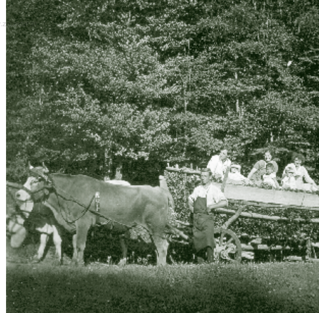
Für die Laubfuhren waren die Leiterwagen mit speziellen Streugattern versehen, die um einiges dichter waren als die normalen Heugatter (Klausen-Leopoldsdorf um 1930).

zungspläne heraus, in denen genau geregelt wurde, wann und in welchen Waldbeständen Streu gerecht werden durfte. Diesen Plänen folgend vergaben die Förster an die Streu rechnenden Familien sogenannte Streu- oder Waldzettel als Genehmigung.