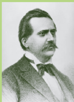
Josef Schöffel, „Retter des Wienerwalds“.