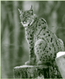
Luchs und Bär lebten in den herrschaftlichen Wäldern.