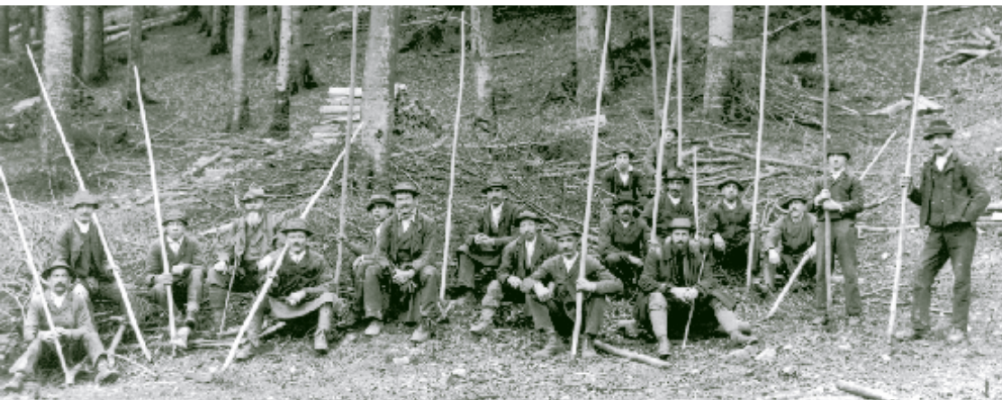
Mit ihren langen „Grießbeilen“ brachten die Schwemmknechte aus Klausen-Leopoldsdorf das Schwemmh Holz auf dem Fluss in die richtige Lage. 1939 fand auf der Schwechat die letzte Trift statt.

Bis zum Aufkommen der Steinkohle war Braunkohle der wichtigste Brennstoff, sowohl für die zahlreichen Schmieden und Eisenhämmer der Umgebung als auch für die Haushalte der nahen Großstadt Wien. Ein Teil des Holzes wurde deshalb direkt vor Ort zu Braunkohle verarbeitet.