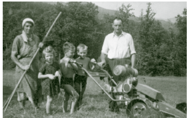
In den 1950er Jahren löste langsam der Motormäher die Sense ab (Nöstach um 1955).

Vor der Einführung der landwirtschaftlichen Maschinen war die Heu- und Grummeternte sehr arbeitsintensiv, und der Bauer musste oft extra Arbeiter dafür anheuern. Das waren meist Holzarbeiter, Pecher und Kleinhäusler, die sich so ein Zubrot verdienten. „Ein guter Mäher hat bis ein Joch Wiese (ca. 1/2 ha) gemäht, wobei um 3 Uhr in der Früh begonnen wurde und mit einer Pause bis Mittag gemäht wurde.“ erzählt ein Altbauer aus Pressbaum.