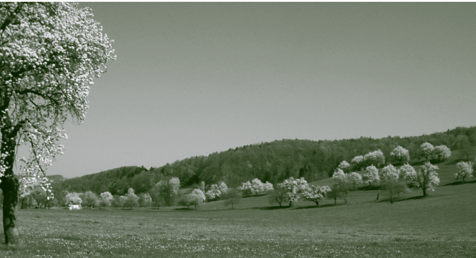
Streuobstwiese im Laabental zur Birnenblüte 2007.

Für die Sortenvielfalt im Obstbau sind diese alten Obstwiesen eine wahre Schatzkammer. Mitunter trägt jeder Baum eine andere Sorte. Der Verein Kultur.Landschaft widmet sich daher in Kooperation mit lokalen ErhalterInnen und der Arche Noah ganz speziell den traditionellen Obstkulturen und der regionalen Sortenvielfalt im Wienerwald.