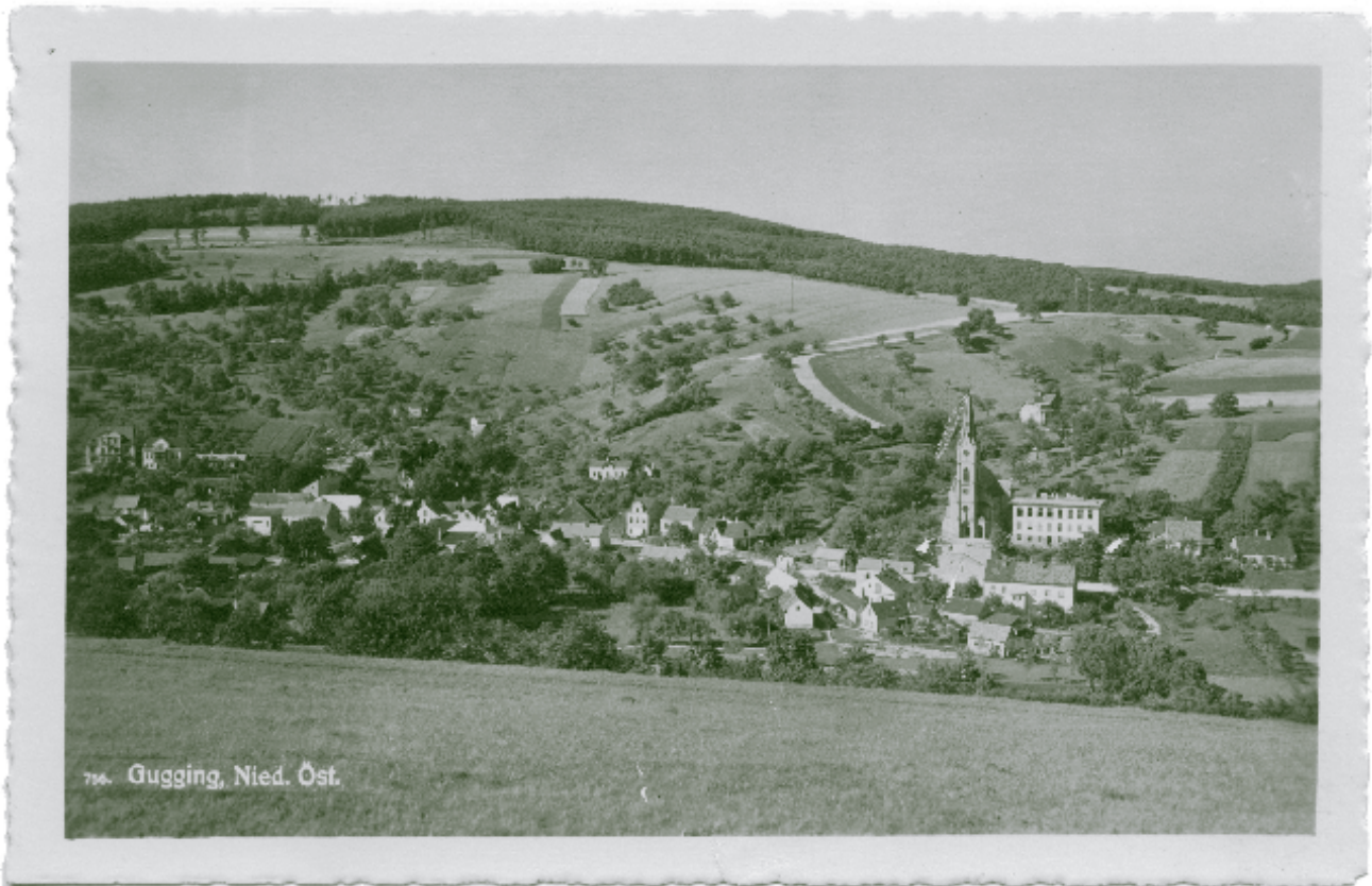
794. Gugging, Nied. Öst.

Blick auf Gugging und seine vielen Streuobstwiesen um 1940.