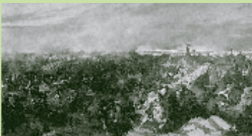
Die Bevölkerung des Wienerwalds litt schwer unter der Türkenbelagerung.