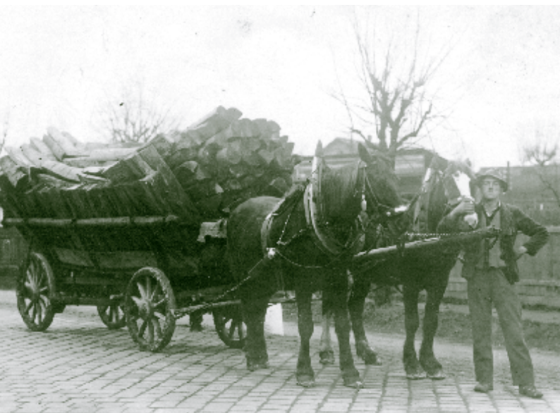
Brennholztransport um 1910.