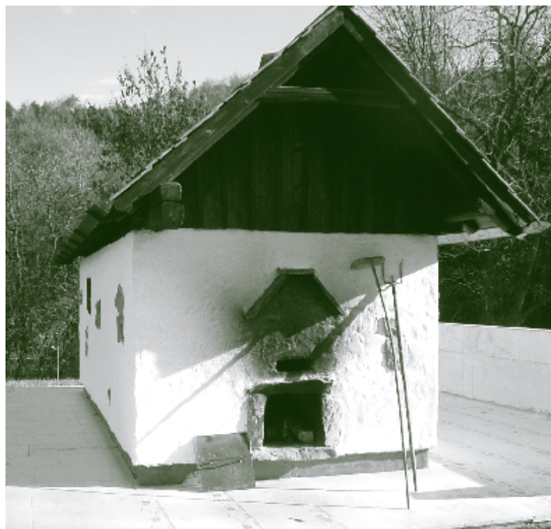
Erneueres Dörrhaus in Neustift-Innermanzing.

Im Gegensatz zum Mostviertel ist im Wienerwald das Dörren heute fast zur Gänze aufgegeben worden. Nur noch vereinzelt sind im Westen einzelne halb verfallene Dörrhäuser zu finden, die meisten sind längst abgerissen. Der Kulturverein der Gemeinde Neustift-Innermanzing versucht dem entgegen zu wirken und hat mit viel Engagement ein altes Dörrhaus wieder instand gesetzt.