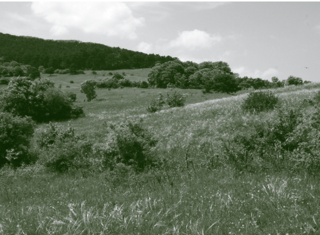
Ein Blick auf die Perchtoldsdorfer Heide im Juni: auf den offenen Flächen blüht das sonnenliebende Federgras (im Vordergrund), aber wo die Büsche sich ausbreiten, wird es ihm schnell zu schattig.