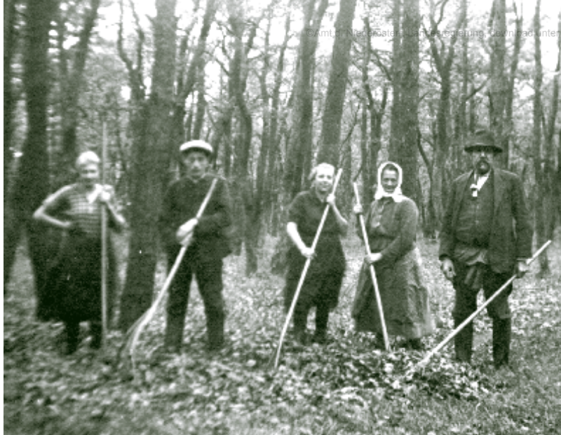
Laubstreurechen im Kritzendorfer Wald.