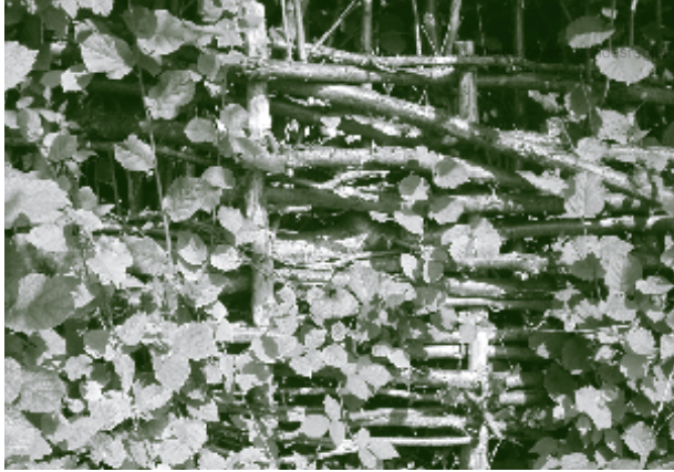
Im angrenzenden Mostviertel sind heute noch Reste kunstvoll geflochtener Zäune (Grenzhager) zu finden.

fast überall mobile Weidezäune an ihre Stelle getreten. Nur wenige Altbauern erinnern sich noch an die Zeiten des „Zäunens“.