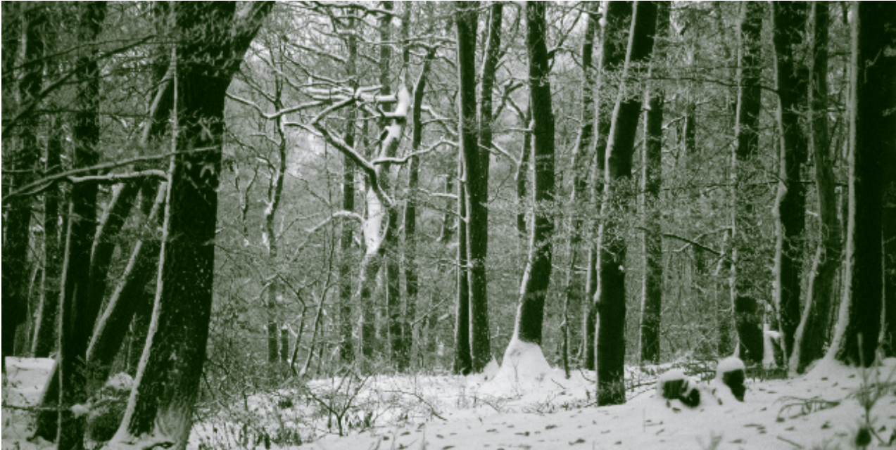
Der Wienerwald: Zu jeder Jahreszeit eine Augenweide.