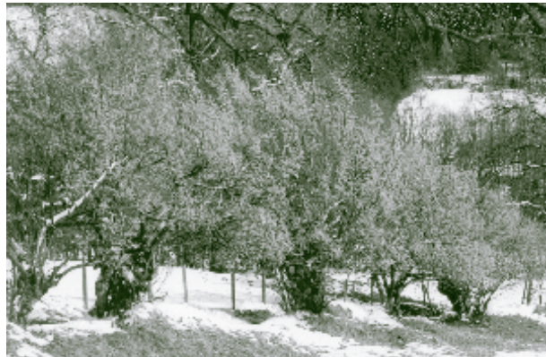
Dirndlblüte im Vorfrühling auf der Kleinleiten im Laabental.

hart und zäh. Das macht es ideal zum Drechseln. Gabeln, Werkzeugstiele und Leitersprossen wurden traditionell aus Dirndlholz gemacht.