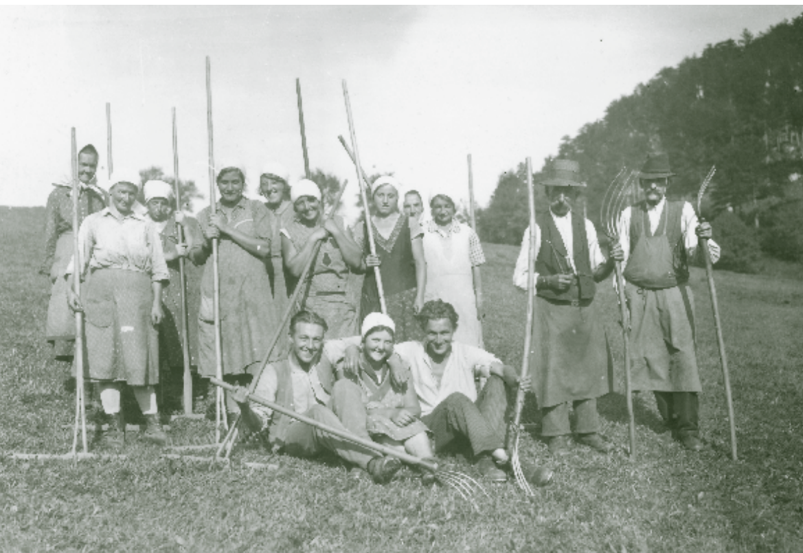
Nach der Heuernte (Altenmarkt um 1920).

Bis ins 19. Jhdt. war die Bewirtschaftung von Wiesen, Weiden, Äckern und Waldflächen im bäuerlichen Betrieb eng verflochten. Die vorherrschende Dreifelderwirtschaft sah auf den Ackerflächen eine jährliche Abfolge von Sommergetreide, Wintergetreide und Brache vor. Kühe, Ziegen, Schafe, Schweine und Gänse wurden den Sommer über auf die gemeinschaftliche Hutweide, die jeweiligen Ackerbrachen oder in den Wald getrieben. Auf die Wiesen durfte das Vieh nicht, denn hier wurde das wertvolle Futter für den Winter gewonnen. Gedüngt wurden ursprünglich nur die Äcker. Erst mit der Einführung neuer Kulturpflanzen wie Klee, Luzerne und Kartoffel und einer besseren Bodennutzung durch den Umstieg zur Fruchtwechselwirtschaft konnte die Produktivität so gesteigert werden, dass auch für die Wiesen Dünger übrigblieb. Vor ca. 200 Jahren sind dadurch die so genannten Fettwiesen oder Wirtschaftswiesen entstanden, die regelmäßig gedüngt werden und zweimal im Jahr gemäht werden können (Grabherr 2004).