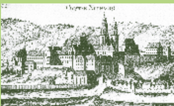
Obstbäume in den Weingärten um Klosterneuburg (1672).