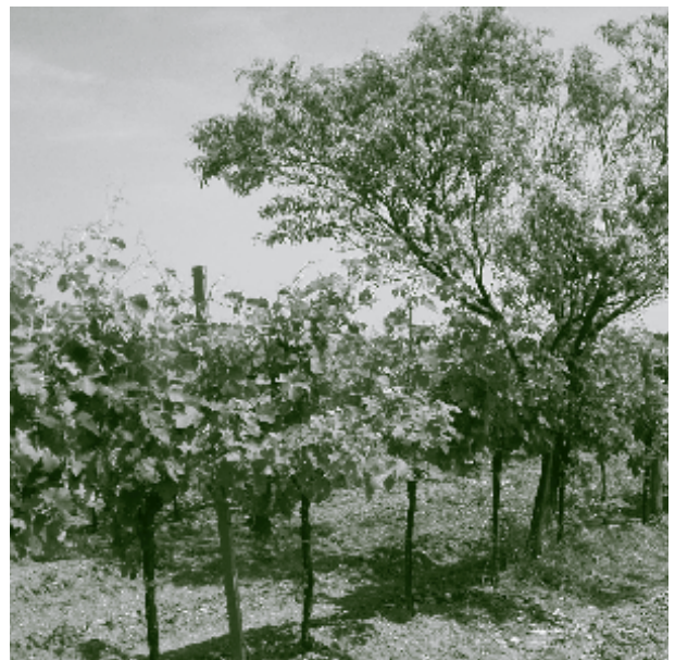
Weingartenpfirsich in Gumpoldskirchen 2006.

Im Norden des Wienerwaldes tauchte 1867 eine kleine Blattlaus aus Amerika auf, die den Weinbau nachhaltig verändern sollte: die Reblaus. Die Schäden an Wurzeln und Blättern waren teilweise so beträchtlich, dass der Weinbau in manchen Orten ganz aufgegeben wurde. In diesen schwierigen Zeiten pflanzten einige Weinbauern Ribiseln in ihre Weingärten. Am bekanntesten ist wahrscheinlich die aromatische und ertragreiche rote Kritzendorfer Ribisel. Anstelle der alten Heurigen lockten jetzt Ribiselheurige die Ausflügler aus Wien. Später importierte man amerikanische Weinsorten die resistent gegen die Reblaus waren und der echte Wein löste den Ribiselwein wieder ab.