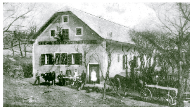
Gaube aus der Gastwirtschaft Wieshäcker aus Steinriegl im Wienerwald.

Der Strukturwandel in der Landwirtschaft hat vor dem Wienerwald nicht halt gemacht. Eine mögliche Antwort auf das geringe Einkommen in der Landwirtschaft sind Betriebsvergrößerungen und Intensivierung der Produktion. Aber auch ein anderer Weg wird von den Wienerwaldbauern erfolgreich eingeschlagen. Traditionelle Nutzungen werden mit neuen Nischen kombiniert. Mutterkuhhaltung, Schafhaltung, Heuverkauf an die steigende Zahl der Pferdhalter, Mostproduktion oder das Brennen erlesener Schnäpse aus Elsbeere und Speierling liegen im Trend.