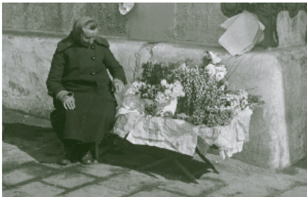
Je nach Jahreszeit verkauften die Frauen aus dem Wienerwald Blumen, Beeren, Pilze oder Palmkätzchen auf den Märkten und an den Straßenrändern.

Erst mit dem Aufkommen der Kultursorten in den Gärten verloren die Waldbeeren an Bedeutung. Im Frühling wurden Blumen wie Veilchen, Mai-glöckchen und Himmelschlüssel gesammelt und auf den Märkten angeboten, im Herbst natürlich Pilze. Palmkätzchen, rechtzeitig gezwickt und im Keller eingelagert, ließen sich vor Ostern ebenfalls gut verkaufen. Einige Familien hatten sich auf das Sammeln von Ameiseneiern spezialisiert, bis ins 19. Jahrhundert ein begehrtes Futter für die vielen Singvögel, die in Wien in Käfigen gehalten wurden.