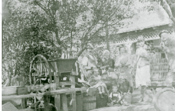
Mostpressen in Steinriegl um 1920.

Getrocknete Äpfel, Birnen und Zwetschken schmecken köstlich und bewahren die Vitamine über lange Zeit. Wer kennt nicht das köstliche Kletzenbrot, ein traditionelles Weihnachtsgebäck aus gedörrten Birnen (Kletzen) und Zwetschken? Natürlich wurde auch im Wienerwald, genau wie im nahen Mostviertel, gedörrt. Es gab eigene Dörrhäuser, die wegen der Brandgefahr immer ein bisschen abseits der Bauernhäuser standen. Darin gab es einen Gewölbeofen der von außen beheizt werden konnte.