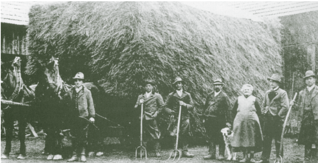
Wiener Heufuhre vor der Abfahrt vom Hof Holzapfel in Altenmarkt um 1930: Der Wagen war so kunstvoll beladen, dass die Fuhre trotz schlechter Straßen bis Wien hielt.

5 Tonnen pro Wagen) von Ochsen oder Pferden gezogen nach Wien. Zwei Tage dauerte die Fahrt über die holperigen Straßen, und es kam in den Dörfern zu regelrechten Menschaufläufen, wenn diese Schwertransporte durchrollten.