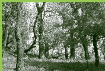
Der Wienerwald – kostbares Erbe für kommende Generationen.