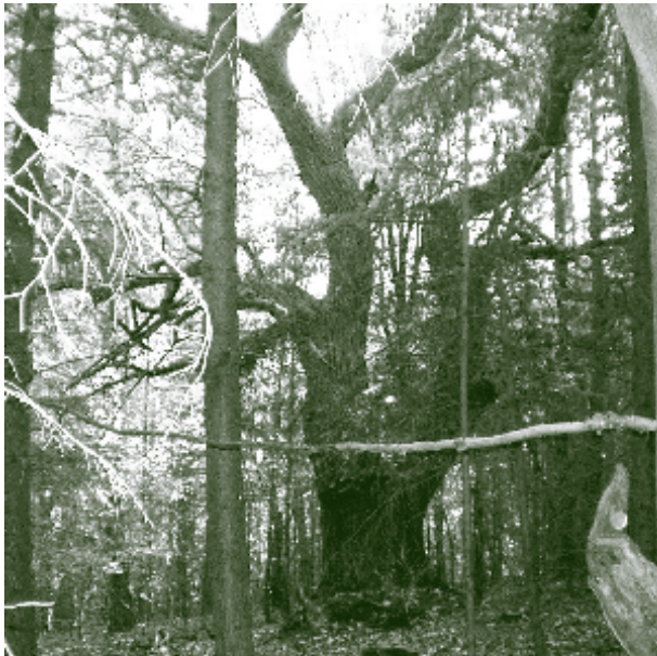
Kaum noch zu erkennen: alte Edelkastanien im Merkensteiner Wald 2006.