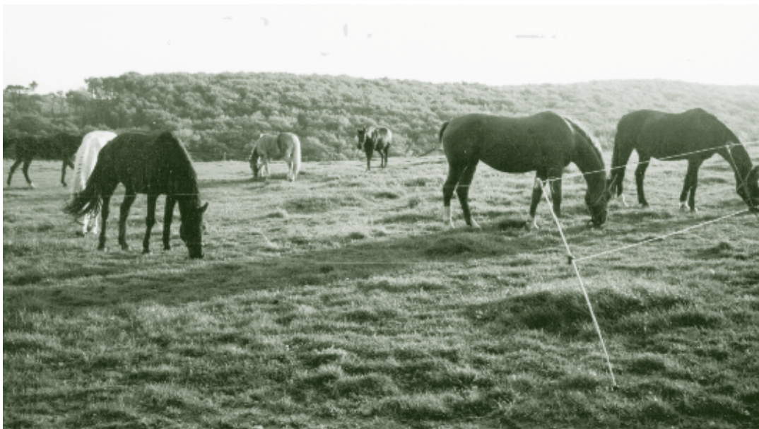
Pferdeweide in Oberkirchbach.

Die Wienerwaldwiesen und Weiden gehören zu den artenreichsten und für den Naturschutz bedeutendsten Lebensräumen in Österreich. Bis zu 500 verschiedene Pflanzen kommen hier vor, darunter viele seltene und bedrohte RoteListe-Arten wie die auffallende Riemenzunge ( Himantoglossum hircinum ) oder das strahlend gelbe Adonisröschen ( Adonis vernalis ). Besonders artenreich sind die extensiv bewirtschafteten Mager- und Trockenrasen. Weil sie dem Bauer aber wenig einbringen, sind sie selten geworden. Jede zusätzliche Düngung und Mahd erhöht zwar den Ertrag, senkt aber die Vielfalt an seltenen Pflanzenarten die dort wachsen können. Um das auszugleichen gibt es staatliche Förderungen für die traditionelle Pflege dieser Flächen.