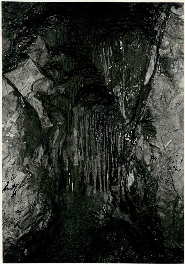
Tropfsteinfi- gur in der Schichthalle

Die ursprünglich vorhandene Fortsetzung des Vorhanges im rechten Bildteil ist durch Sickerwasserkorrosion und Tropfwassererosion fast zur Gänze abgetragen und zerstört worden.