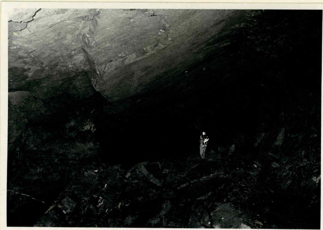
S c h i c h t h a l l e Die Höhlendecke besteht aus Schichtflächen im Dachsteinkalk.

Blick vom Endpunkt des Eingangsstollens durch die Halle gegen SSW. Die Silhouetten der Personen, die auf der Galerie am Zustieg zum Tropfsteinteil stehen (Schnittpunkt der am Bildrand angegebenen Pfeilrichtungen) lassen die Ausmaße des Raumes erkennen.