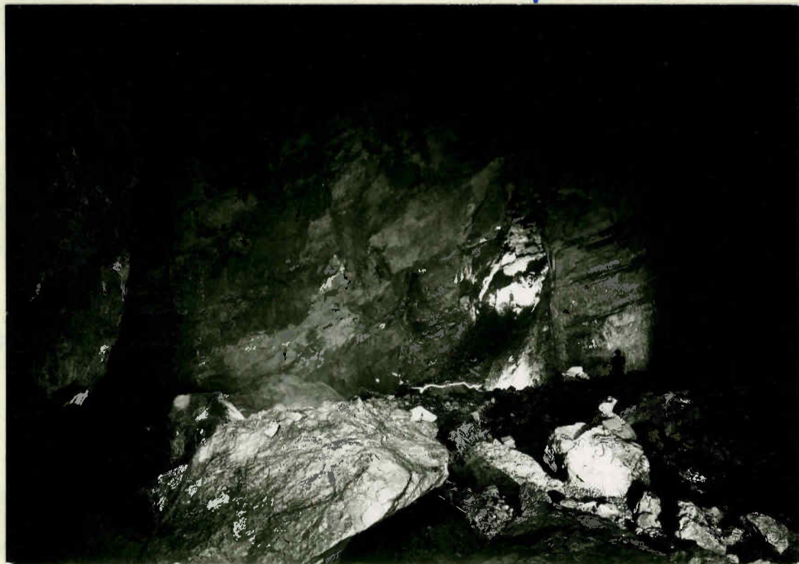
Großer Dom Blick quer durch die Halle gegen die Seekluft. Die Personen in der Hallenmitte rechts und im Hintergrund der Halle (Schnittpunkt der Pfeilrichtungen) zeigen die Raumgröße.