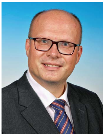
Günter Stöger wurde mit Wirksamkeit vom 1. Juli 2021 zum neuen Bezirkshauptmann in Krems an der Donau bestellt.