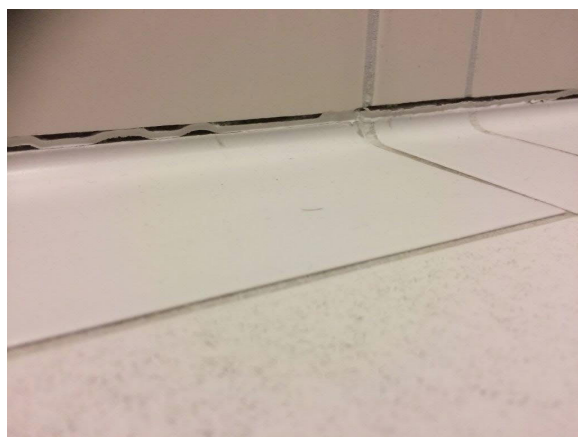
Hohlkehlen-Fliese RICHTIG verlegt (liegend). Wasser kann trotz bereits undichter Silikon-Fuge nicht in die Mauer eindringen

Bei keramischen Fußböden ist die geforderte dichte Verbindung zwischen Boden- und Wandbelag durch Verwendung von Hohlkehlen-Formstücken herzustellen.