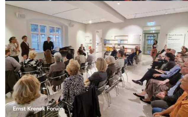
Ernst Krenek Forum