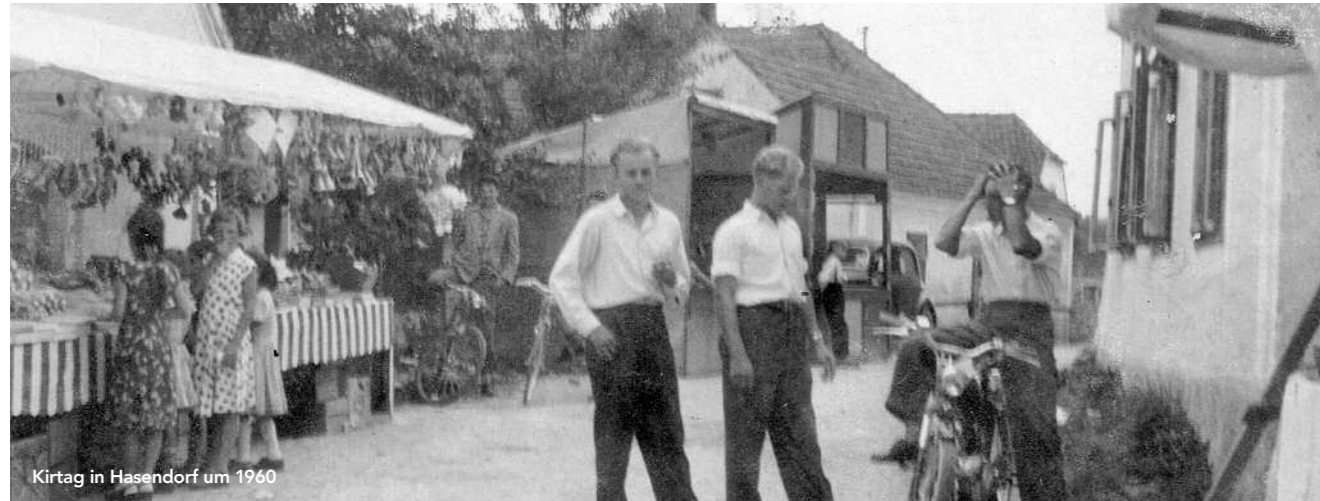
Kirtag in Hasendorf um 1960

Den Begriff Kirtag kennen in Niederösterreich Alt und Jung. Der Kirtag hat – so wie viele Feste rund ums Jahr – seine Wurzeln in der christlichen Tradition: Das Fest der Kirchweihe, wie dieser Tag ursprünglich hieß, existiert seit dem Mittelalter und ehrt die jährliche Wiederkehr des Tages der Weihe einer Kirche. Seit Jahrhunderten begeht man diesen Tag mit einer Messe zu Ehren des Kirchenpatrons und vergnügt sich anschließend bei den Ständen rund um das Gotteshaus, reichlich Kulinarik inklusive – Schaumrollen vom Konditor, Lebkuchenherzen für die Liebsten. Dazu Spielzeug für die Kinder, Blasmusik, Tanz, Geselligkeit, und natürlich begab man sich auch auf Brautschau. Was mitunter auch zu kleineren Handgreiflichkeiten, der Kirtagsrauferei, führte.