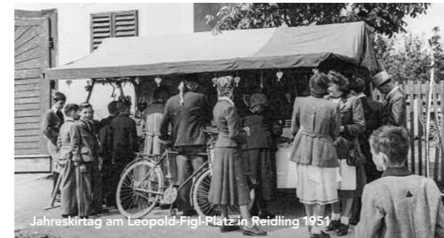
Jahreskirtag am Leopold-Figl-Platz in Reidling 1951

Mit einem genussvollen Programm zu Ehren der Dirndl feiert das Pielachtal am 5. und 6. Oktober seinen Dirndlkirtag. Schauplatz ist heuer die Gemeinde Frankenfels, wo fesche Dirndl in festlichem Dirndl-Outfit leuchtend rote Dirndl naschen werden. Namensgeber des Kirtags ist die Kornelkirsche, die im Volksmund Dirndl genannt und traditionell zu Marmeladen oder Schnäpsen weiterverarbeitet wird. Alljährlich zu ihrer Erntezeit erklärt das Pielachtal, das sich im Mostviertel als „Tal der Dirndl“ einen Namen gemacht hat, an zwei Tagen einen Ort zur Festzone. Neben der Wildfrucht stehen an diesen beiden Tagen auch die anderen Dirndl, also die textile Tracht und deren weibliche Trägerinnen, im Mittelpunkt des festlichen Geschehens. Jedes zweite Jahr wird auch eine neue „Dirndlkönigin“ gekürt, die das Pielachtal als Dirndl-Botschafterin bei diversen Anlässen vertritt. Kulinarisch verwöhnt der Dirndlkirtag natürlich mit Dirndl-Spezialitäten, die es an zahlreichen Ständen zu verkosten und zu kaufen gibt – von der Dirndlbowl zum Dirndlbrand, von der Dirndltorte zur Dirndlrolle, einem mit Dirndl gefüllten Ziegenkäse. Der durch musikalische und sportliche Ereignisse umrahmte Dirndlkirtag ist außerdem ein „Green Event“: Einweggeschirr wird vermieden, regionale Lebensmittel kommen auf den Tisch, und die „Himmelstreppe“ ermöglicht eine klimafreundliche Anreise.